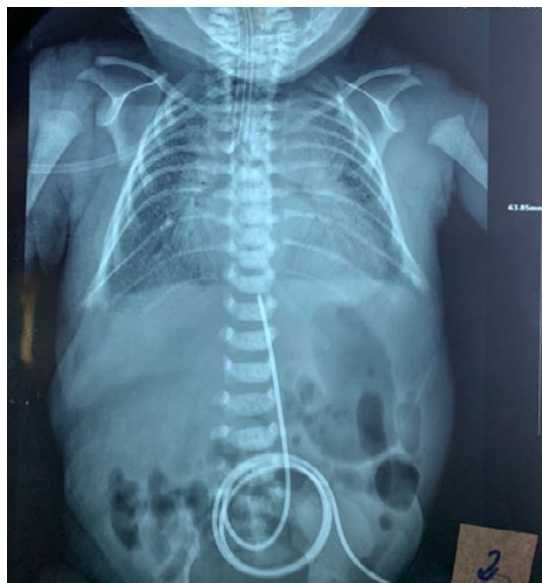
Figura 3: Cardiomegalia con hiperflujo, núcleos de osificación reducidos.

El estudio radiológico de tórax mostró núcleos de osificación reducidos en el nivel óseo, cardiomegalia (índice cardiotorácico de 0.66), hiperflujo e hipertensión venocapilar (Figura 3). La gasometría arterial realizada a la hora de vida evidenció acidosis mixta con hipercapnia e hipoxemia. No se logró realizar el cariotipo.