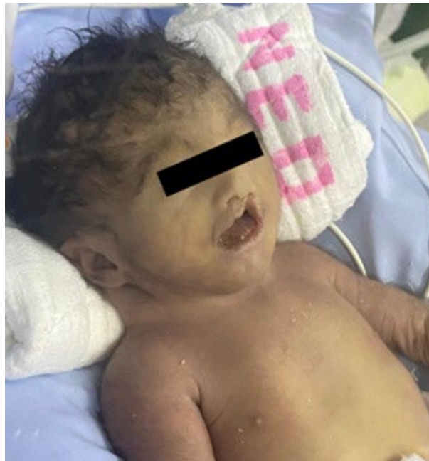
Figura 1: Alteraciones craneofaciales, mamilas hipoplásicas y separadas.

Producto femenino nacido con 35 semanas de gestación, peso al nacimiento de 2400 gramos, talla de 45 cm (percentil adecuado para la edad gestacional) y perímetro cefálico de 34.5 cm (percentil 90). Presentó ausencia de llanto, hipotonía y cianosis al nacer, por lo que se administró reanimación neonatal con ventilación a presión positiva (un ciclo). Apgar de 5 al primer minuto y de 7 al quinto minuto. Debido a dificultad respiratoria y cianosis persistente, se trasladó a la unidad de cuidados intensivos neonatales.