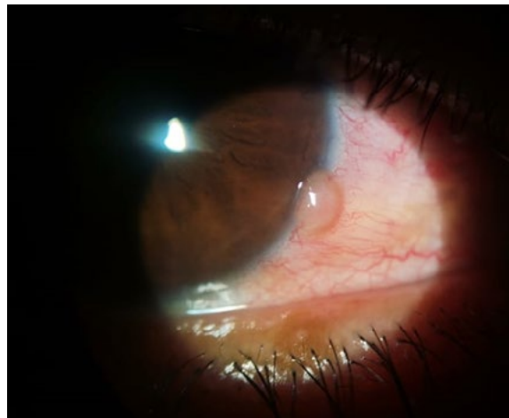
Imagen 2. Lesión conjuntival.

se le proporcionaron instrucciones detalladas sobre la correcta aplicación del colirio y medidas para minimizar los posibles efectos secundarios (7).