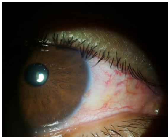
Figura 3. Recuperación posterior al tratamiento a los cinco meses.

Durante el tratamiento, el paciente presentó hiperemia conjuntival y epitelización retardada como efectos secundarios, los cuales fueron controlados mediante el uso de lubricantes oculares y esteroides tópicos a bajas dosis. Después de cinco meses de tratamiento, se evidenció una reducción significativa del tamaño de la lesión (figura 3). En este punto, se realizó un control mediante una nueva ultrabiomicroscopía.